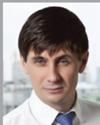
ДЕНЬГИН ВАДИМ ЕВГЕНЬЕВИЧ

Председатель Комитета Государственной Думы ФС РФ по промышленности