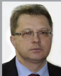
ВЛАСОВ СЕРГЕЙ ЕВГЕНЬЕВИЧ

Первый заместитель Председателя Комитета по информационной политике, информационным технологиям и связи, Фракция ЛДПР