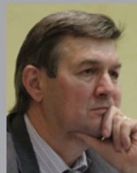
КРИТЕНКО МИХАИЛ ИВАНОВИЧ

Директор департамента развития научно- производственной базы ядерного оружейного комплекса Федерального агентства по атомной энергии РОСАТОМ